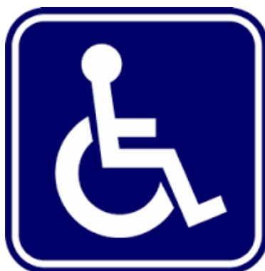
สัญลักษณ์ผู้พิการ